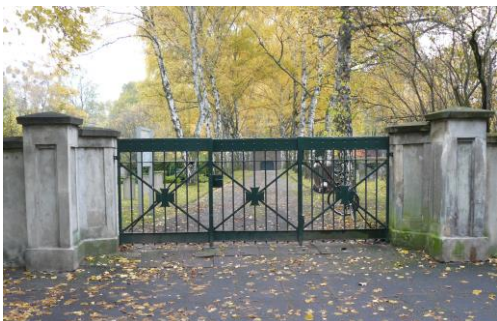
Eingang Fössefeldfriedhof, Friedhofstraße

Am 10. April 1945 zog die US-Armee von Westen kommend durch die Limmerstraße in die Innenstadt von Hannover und beendete damit die Herrschaft der Nationalsozialisten in Hannover. Am 8. Mai, also vor siebzig Jahren, endete der 2. Weltkrieg. Im Umfeld des 8. Mai gedenkt die Otto Brenner Akademie in Zusammenarbeit mit anderen Projekten wie Quartier e.V. und SJD Falken einiger der Opfer des Nationalsozialismus. Im Mittelpunkt stehen die Themen Deserteure, Zwangsarbeit, Widerstand und Arbeiterbewegung in Linden/Limmer.