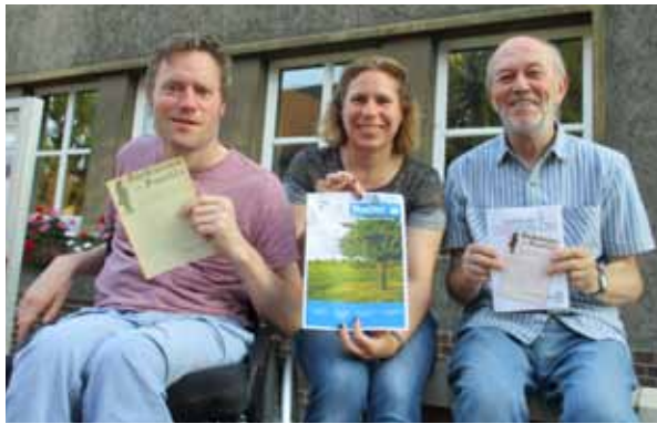
Das Redaktionsteam der Sackmann-Postille verabschiedet sich.

Ab dem neuen Kirchenjahr im Advent werden wir uns an der Kirchenzeitung VorOrt beteiligen und einbringen, die schon seit einigen Jahren in unserem Nachbarstadtteil Linden erscheint. Wir erhoffen uns davon eine größere Transparenz in beide Richtungen. Zum einen wird das Angebot unserer Kirchengemeinde einem größeren Kreis zugänglich, zum anderen bekommen wir in Limmer auch einen besseren und verlässlichen Eindruck von den Angeboten der Kirchengemeinden in Linden.