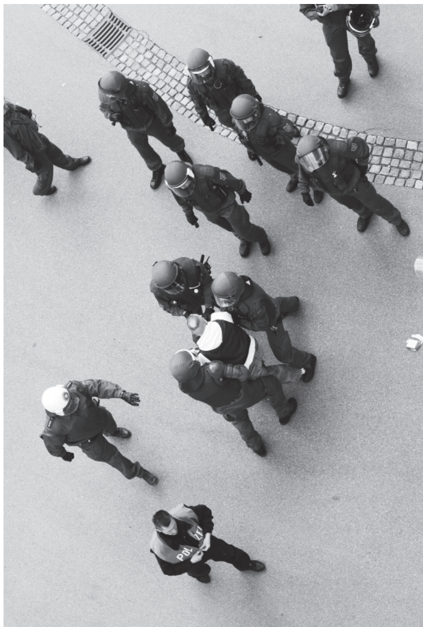
Polizeiaktion am Rande eines Fußballspiels, Aue 2006.