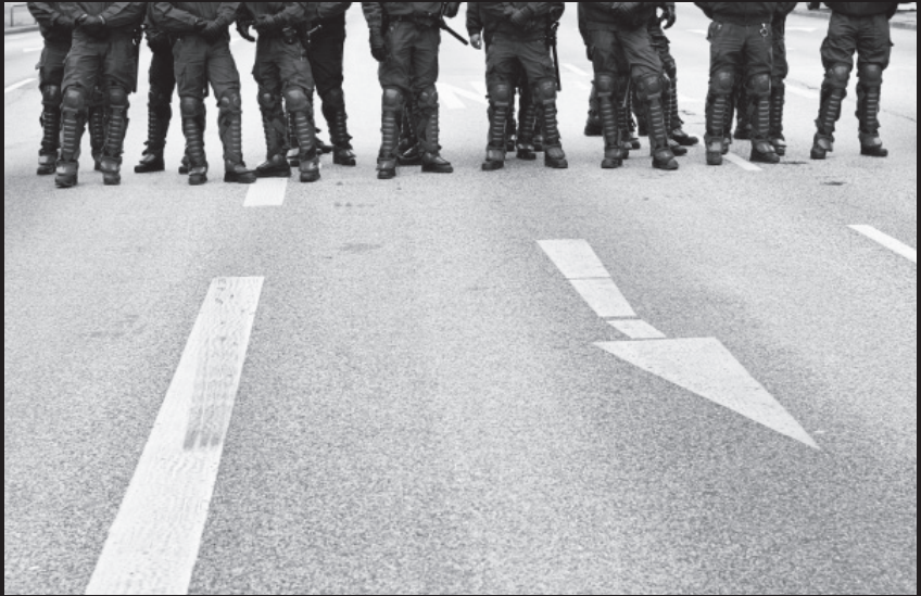
Straßensperre bei Demonstration gegen den ASEM-Gipfel vor G8-Gipfel, Hamburg 2007.