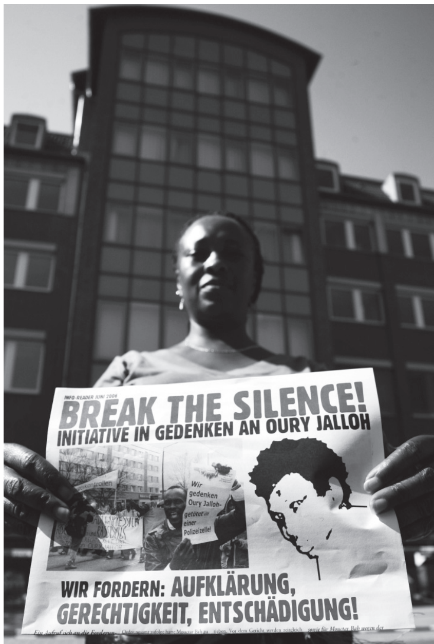
Eine Demonstrantin protestiert vor dem Landgericht in Dessau in Gedenken an Oury Jalloh, September 2006.