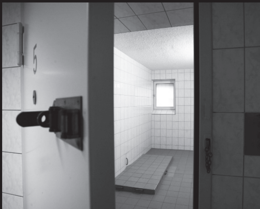
Die Verwahrzelle des Polizeireviere Dessau, in der Oury Jalloh, ein Asylbewerber aus Sierra Leone, im Januar 2005 unter bislang ungeklärten Umständen verbrannte.