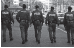
Polizeibeamte patrouillieren durch die Leipziger Innenstadt, März 2008.

Des Weiteren fordert Amnesty International die Behörden dazu auf, umgehend Maßnahmen zu ergreifen, die eine einfache Identifizierung von Polizeibeamten bei der Ausübung ihrer gesetzlichen Pflichten (einschließlich Festnahme, Ingewahrsamnahme und Anwendung von Gewalt) gewährleisten.