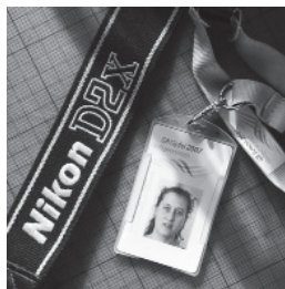
Der Presseausweis von KI, den sie während des mutmaßlichen Angriffs durch Polizeibeamte zeigte.