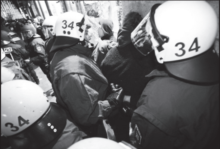
Polizisten der Einheit 34 führen in der Hamburger Innenstadt einen festgenommenen Demonstranten ab, Dezember 2009.