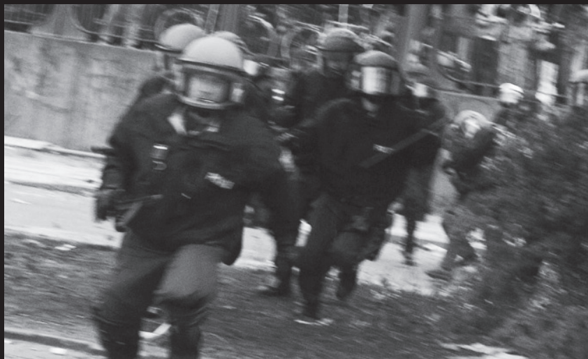
Heranstürmende Polizeibeamte beim G8-Gipfel in Heiligendamm. Fotografiert von der Fotojournalistin KI, bevor sie von einem oder mehreren der Beamten mutmaßlich mit Schlagstöcken geschlagen wurde, Juni 2007.