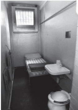
Blick in eine Zelle des Polizei-gewahrsams in Frankfurt am Main, 1996.