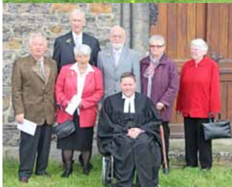
Die Diamantenen Konfirmanden

deshalb zu diesem Tag auch das Kaffeetrinken am Nachmittag im Gemeindehaus, bei dem alle Fragen beantwortet und Erinnerungen geteilt werden konnten. Das Programm, das ich für den Nachmittag vorbereitet hatte, brauchte ich nicht auszupacken: Es gab Wichtigeres zu sagen und zu hören von den Hauptpersonen des Tages. Ich war gerne mit dabei. PASTOR JAKOB KAMPERMANN