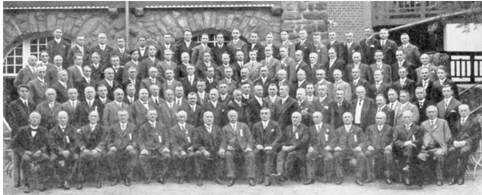
Männer-Gesang-Verein Limmer 1930