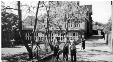
Kindertagesstätte und Kinderheim in der Brunnenstraße 22 in den 1950er Jahren.

Dort sollten vor allem die Kinder erwerbstätiger Mütter während ihrer Arbeitszeit betreut werden. Am 2. Juli 1906 wurde dann die Warteschule feierlich eröffnet.