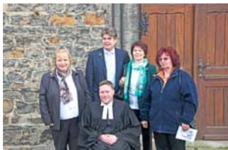
Die Goldenen Konfirmanden

In den Jahren nach der Konfirmation hat sich mancher verändert. Alle haben viel erlebt. Das musste erst einmal erzählt werden. Wie der Gottesdienst am Vormittag gehörte