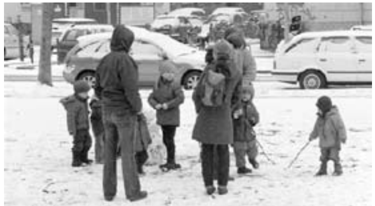
Nach dem GROSS und klein Gottesdienst bauen GROSSE und kleine Leute GROSSE und kleine Schneefamilien