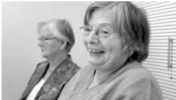
Das Geburtstagskind freut sich über die vielen guten Ideen!

Wo der Himmel über uns geöffnet ist, da wird die Fremde zur Heimat.