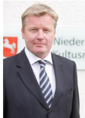
Dr. Bernd Althusmann