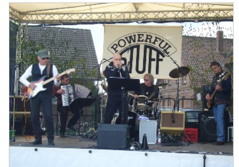
Kommen: Powerful Staff spielen Premium Bluesrock

3. Hoffest am Samstag, 19. Juni in der Wunstorfer Straße 86