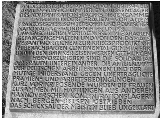
■ Die 1987 errichtete (eher unauffällige) heutige Gedenktafel an der Ecke Stockhardtweg/Sackmannstraße.

Am 6. April wurde das Lager geräumt und die Häftlinge gezwungen, nach Bergen-Belsen zu marschieren. Wie viele auf