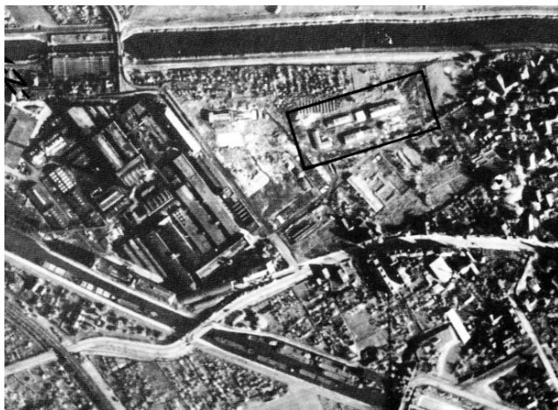
■ Luftbild des ehemaligen Frauen-KZs Limmer, Oktober 1945. Südlich und westlich des KZs sind die Fundamente der 1943 zerstörten Baracken des Zwangsarbeiterlagers zu erkennen.