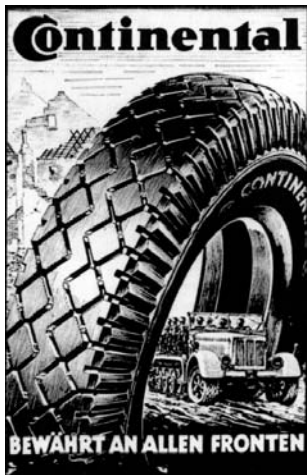
■ Werbeplakat der Continental während des 2. Weltkriegs.

Neben der Zwangsarbeit im Continental-Werk und in den Brinker Eisenwerken unter unmenschlichen Bedingungen wurden sie auch zu Enttrümmerungsarbeiten im Stadtteil