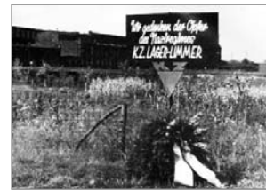
■ Gedenktafel des »Hauptausschusses ehemaliger politischer Häftlinge«, September 1947. Im Hintergrund die Fabrikgebäude der Continental.

Ende 1944 waren rund 40 Prozent der Arbeitskräfte in Hannover ZwangsarbeiterInnen oder Häftlinge.